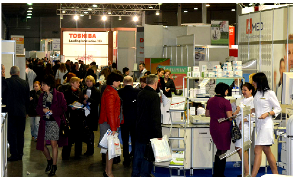
Мал. 2. У залі виставки, 2016.

представлені лікарські препарати, парафармацевтична продукція, товари медичного призначення, лікувальна косметика, комплексне оснащення аптек, послуги для фармацевтичного ринку.