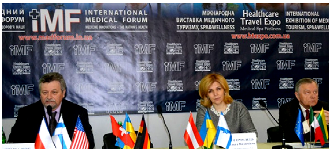
Мал. 1. Президія VI Міжнародного медичного форуму «Інновації в медицині – здоров'я нації» (зліва праворуч): академік НАМНУ, проф. Віталій Цимбалюк, проф. Ольга Богомолець, проф. Юрій Вороненко (2015).

грес «Впровадження сучасних досягнень медичної науки у практику охорони здоров'я України» - 2015 (мал.1).