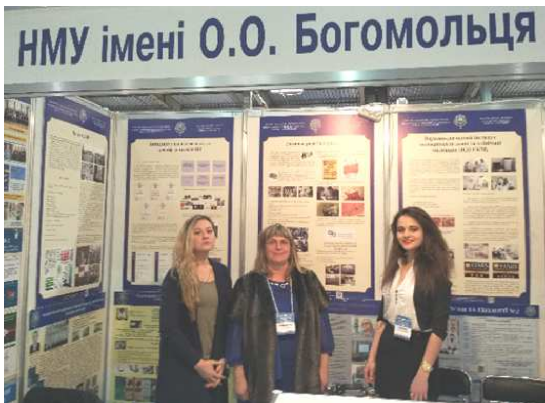
Мал. 1. Біля стендів конгресу.

Заслухано 700 спікерів-фахівців галузі охорони здоров'я. Активно працювали секції «Організація і управління охороною здоров'я», «Дні приватної медицини», «Дні лабораторної медицини», «Медична радіологія», «Організація управління фармацією», «Медичний туризм», «Функціональна діагностика», «Військова медицина», «Медицина невідкладних станів», «Фізична терапія і реабілітація», «Загальна практика _ сімейна медицина» та інші. На Форумі розглядались питання сучасної хірургії, нейрохірургії, кардіохірургії, онкології, ендоскопії, комбустіології та інші.